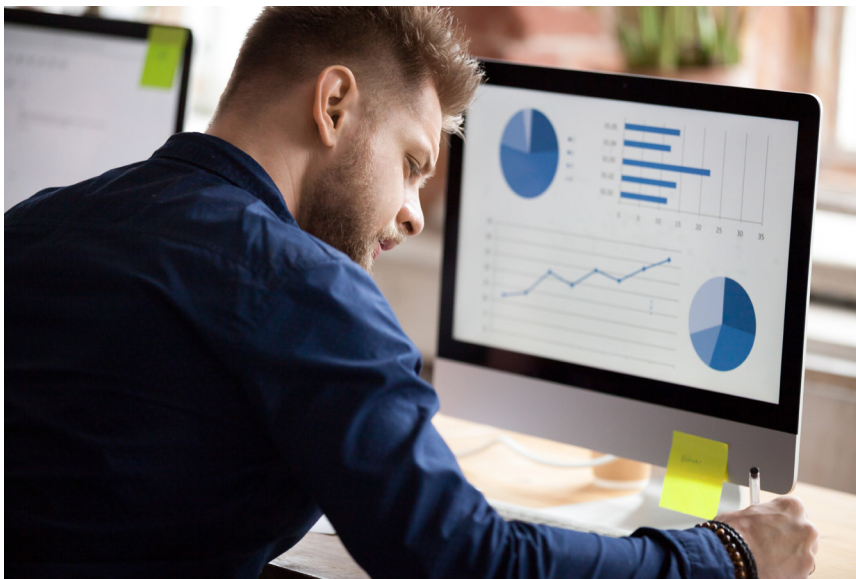
Analyse von Online-Vertriebskanälen

Durch den E-Commerce entstanden in den letzten Jahren neue Tätigkeitsfelder, Prozesse und Geschäftsmodelle mit eigenen Arbeitsweisen und Vorgängen, die durch die etablierten kaufmännischen Ausbildungsberufe nicht abgedeckt waren. Das machte einen neuen Ausbildungsberuf erforderlich, der für die kaufmännischen Tätigkeiten im E-Commerce qualifiziert. Im Steckbrief werden die Aufgaben, Entwicklungsmöglichkeiten und Zahlen zu dem seit 2018 neuen Beruf vorgestellt.