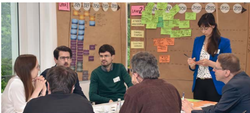
Expertengremium des dritten Strategieworkshops „transform_EMN“ bei der Weiterentwicklung der regionalen „Transformationsstrategie Automotive“. Unter professioneller Moderation wurden Handlungsempfehlungen für Unternehmen des Automotive-Sektors zur erfolgreichen Bewältigung des Transformationsprozesses erarbeitet.

Die nächste Zukunftswerkstatt Automotive Metropolregion Nürnberg findet am Mittwoch, den 2. April 2025, im Kongresshaus Rosengarten, in Coburg statt. ■