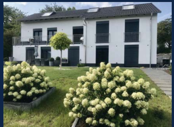
Besonderer Neu-/ Altbau 2022: Einzigartiges MFH mit 5 perfekten Wohnungen, Fußbodenheizung, Garten-nutzung, Balkon, Stellplätze, Garagen, Vesteblick