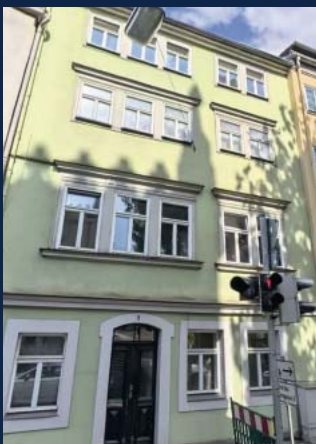
Mehr als 6,30 % Rendite: Renoviertes MFH mit 5 Wohnungen, Stadtzentrum