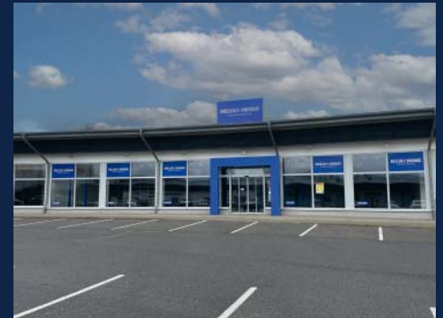
Rödental, ADMIRA CENTER, ca. 900 qm Verkaufsfläche, ab sofort