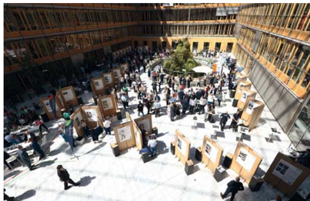
Auf dem „Markt der Möglichkeiten“ wurden in Berlin von den jeweiligen Akteuren innovative Projekte im Bereich Ausbildung, Weiterbildung und Fachkräftezuwanderung vorgestellt.

Der IHK-Tag hat sich mit seiner erfolgreichen Premiere als wegweisendes Forum erwiesen, bei dem Mitglieder der IHK-Organisation, Unternehmen, Politik und Experten gemeinsam an aktuellen Herausforderungen der Wirtschaft arbeiten. Die positive Resonanz bestärkt die DIHK darin, den nächsten IHK-Tag 2026 mit neuen Schwerpunkten zu planen. ■