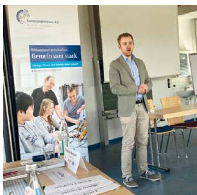
Unter dem Motto „Gemeinsam stark – Coburger Firmen und Schulen bilden Zukunft“ lag der Fokus der Veranstaltung auf dem Einstieg ins Berufsleben.

Gerade im ländlichen Raum fällt es ortsansässigen Firmen immer schwerer, ihre Ausbildungsplätze zu besetzen. Daher kamen in der vom Kompetenzzentrum 4.0 Maschinen-Anlagenbau und Automotive an der IHK zu Coburg gemeinsam mit der Wirtschaftsförderung des Landkreises Coburg organisierten Veranstaltung Vertreter/innen der Mittelschulen in Ebersdorf und Sonnefeld mit Unternehmensvertreter(n)/innen aus dem Osten des Coburger Landes zusammen, um zu diskutieren, wie zukunftsgerichtete Berufsorientierungsmaßnahmen aussehen könnten. Mit dabei waren auch Vertreter der Agentur für Arbeit Bamberg-Coburg und der Handwerkskammer Oberfranken.