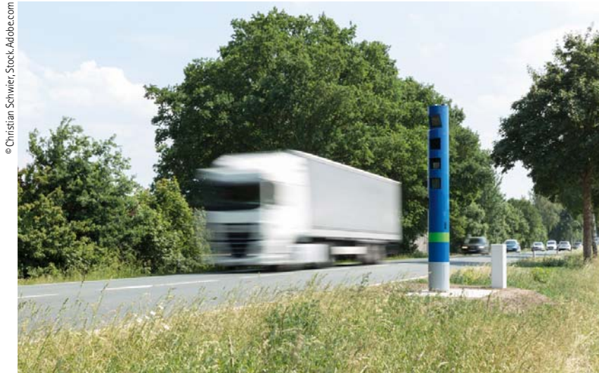
Mautkontrollsäule an einer Bundesstraße