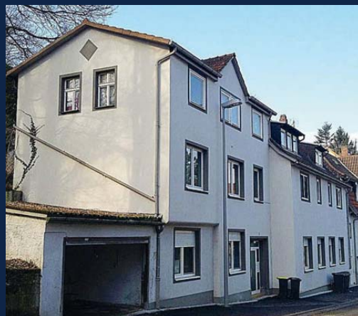
Neuer Preis: Coburg Zentrum: fast 6,00 % RENDITE: 2 x MFH mit 10 Wohnungen, alles vermietet