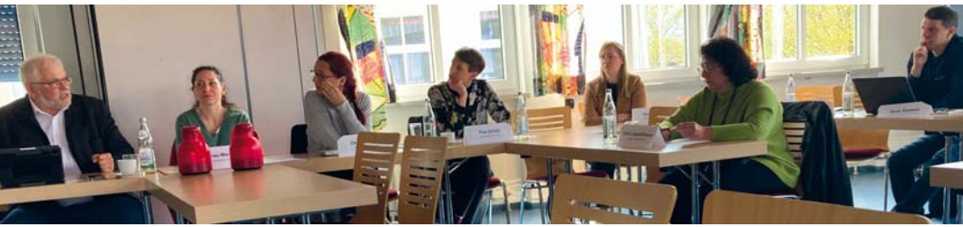
Teilnehmer/innen aus Unternehmen, Schulen und Verbänden diskutierten in Ebersdorf lokale Maßnahmen für eine bessere Berufsorientierung.