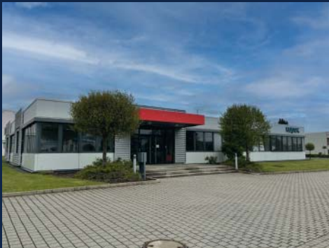
Bürofläche in Rödental: Nähe Ausfahrt A 70, Möbelstadt Schulze, ca. 758 qm, ab sofort