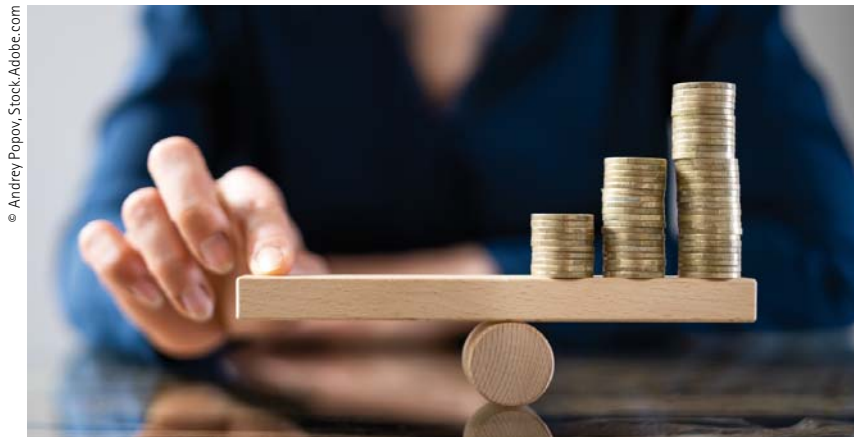
Kleines Geld, kein Kleingeld – Mikrokredite sind bei geringem Kapitalbedarf interessant.