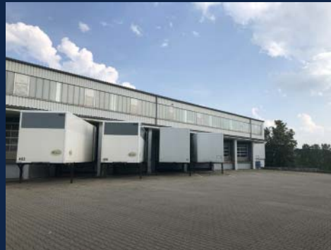
Südlich von Coburg, ab sofort, ca. 5.000 qm Lager- und Logistikfläche, Rampentore