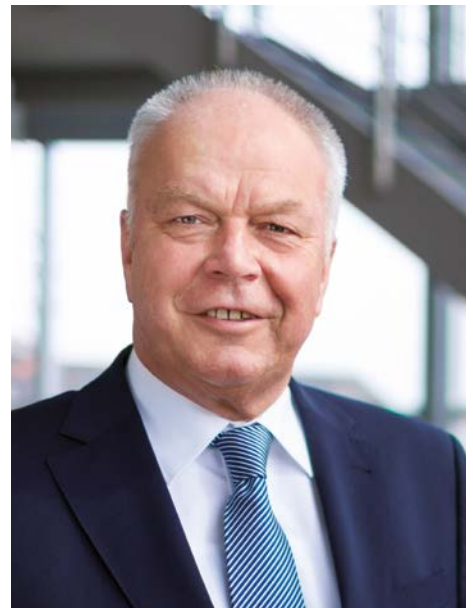
Dr. Günter Brunsch Präsident IHK Dresden

Ohne Genehmigungen geht für Betreiber von industriellen Anlagen und für Träger von Infrastrukturvorhaben gar nichts. Jede neue Investition und jede Änderung muss zunächst behördlich abgesegnet werden, bevor die eigenen Planungen in die Tat umgesetzt werden können.