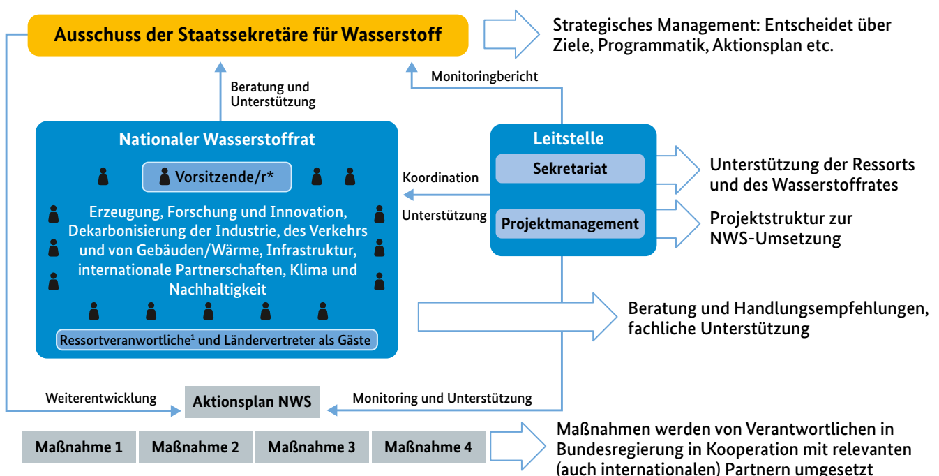
Abbildung 1: Governance-Struktur der Nationalen Wasserstoffstrategie

Aufgabe des Nationalen Wasserstoffrats ist es, den Staatssekretärsausschuss durch Vorschläge und Handlungsempfehlungen bei der Umsetzung und Weiterentwicklung der Wasserstoffstrategie zu beraten und zu unterstützen. Um die Koordination zwischen Bundesregierung und Wasserstoffrat sowie eine enge Anbindung des Rates an die operative Arbeit der Ressorts bei der Umsetzung der NWS zu gewährleisten, tagen der Staatssekretärsausschuss und der Nationale Wasserstoffrat in regelmäßigen Abständen gemeinsam. Zudem nehmen die Ressortverantwortlichen (z. B. die zuständigen Abteilungsleitungen) der betroffenen Ministerien als Gäste an den Sitzungen des Rates teil. Auf Wunsch der Länder können auch zwei Repräsen-