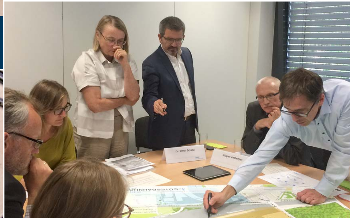
Schlüsselprojekte im Offenbacher Osten

(© Albert Speer und Partner GmbH / Stadt Offenbach am Main)