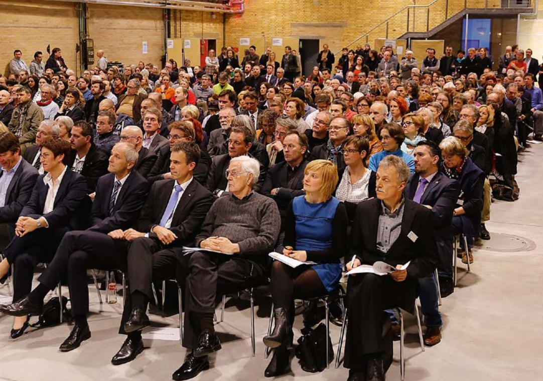
Auftaktveranstaltung im März 2015 in der Alten Schlosserei in Offenbach