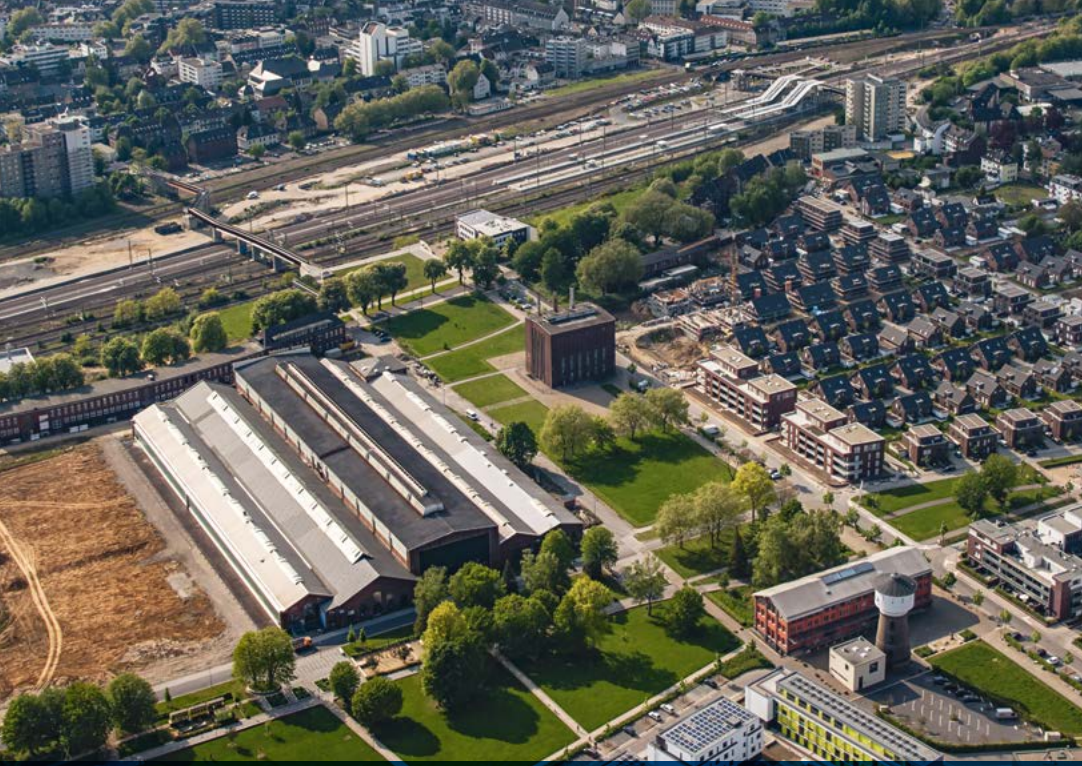
Wohngebiet und freigemachter Campusstandort (links) 2017